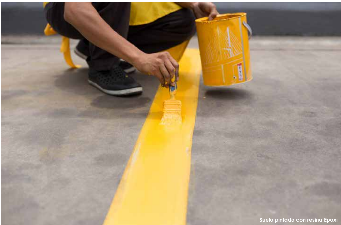
_ Suelo pintado con resina Epoxi