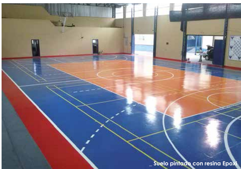
_ Suelo pintado con resina Epoxi